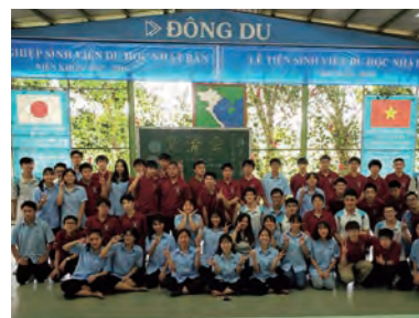
※2023年度より中学3年希望者ベトナム研修・台湾研修(選択制)